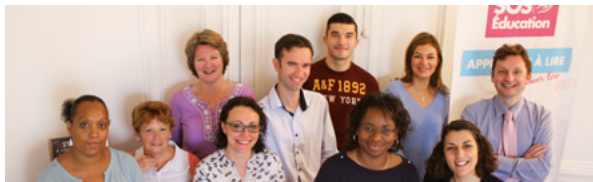
L'équipe des permanents de SOS Éducation.

Vous pouvez vous mobiliser auprès de SOS Éducation de plusieurs manières.